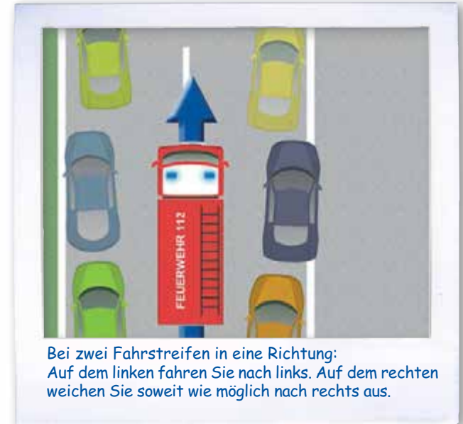
Bei zwei Fahrstreifen in eine Richtung: Auf dem linken fahren Sie nach links. Auf dem rechten weichen Sie soweit wie möglich nach rechts aus.